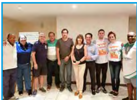
Representantes de Sorocaba/SP, Araçoiaba da Serra/SP, Itapeva/SP e Salto de Piraporã/SP