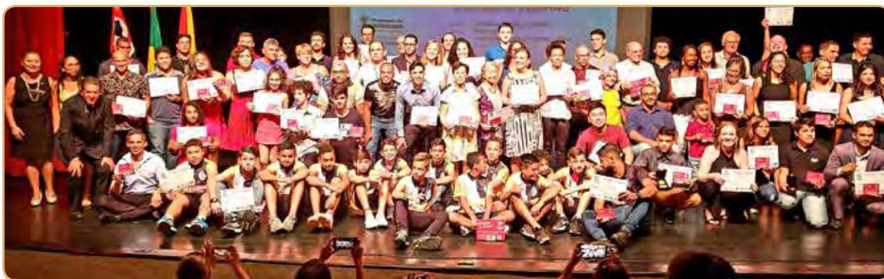
Homenageados da 37ª Festa do Esporte