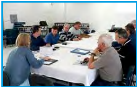
Convívio do Panathlon Club São José dos Campos