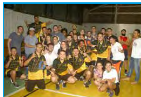
Turma do 5º período de 2019, campeã dos Jogos da Educação Física