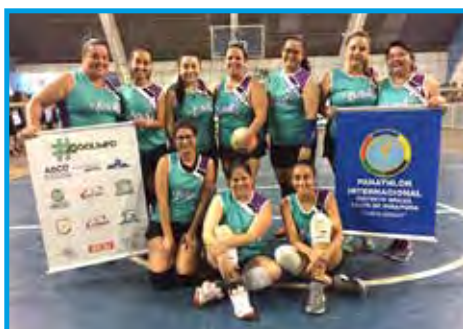
Equipe Boralá de voleibol adulto