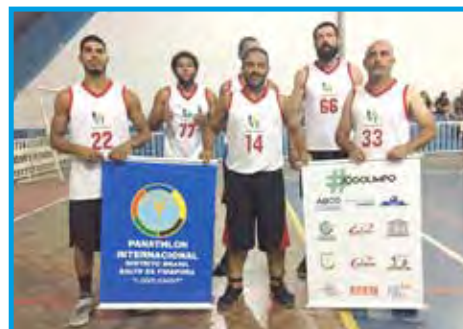
Equipe adulta de basquete do B2T