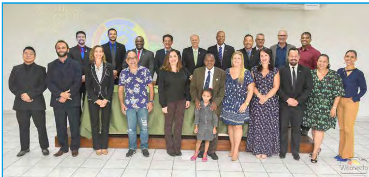
Autoridades e fundadores do Panathlon Club Praia Grande/SP

A cidade de Praia Grande tem uma das praias mais movimentadas do Brasil, tendo sido eleita pelo Ministério do Turismo como a 4ª cidade que mais recebe turistas no país durante a temporada de verão, depois de São Paulo, Rio de Janeiro e Florianópolis. Na alta temporada, recebe cerca de 1,86 milhão de turistas, mais de cinco vezes a sua população fixa, que também vem se expandindo rapidamente, com crescimento de 56 mil habitantes entre 2000 e 2009, e por esse motivo recebeu o título de "a cidade que mais cresce no Brasil".