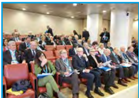
Participantes da Assembleia Geral do Distrito Itália