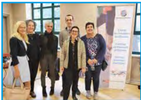
Equipe de trabalho que fez a tradução simultânea durante Assembleia