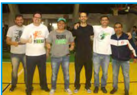
Professores da Faculdade de Educação Física