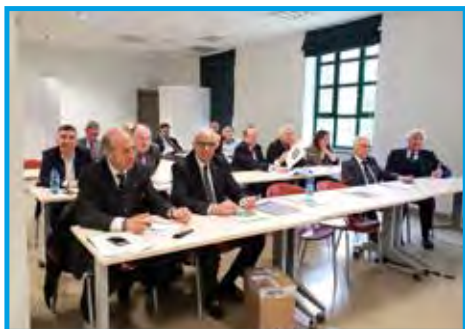
Plano geral dos participantes da Assembleia da Área 02 Lombardia do Distrito Itália