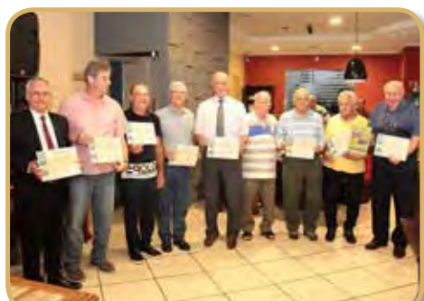
Panathletas campeões do Torneio Cruzeiroão de Futsal em diversas edições