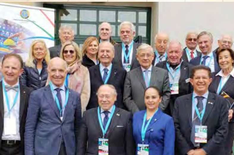
Itália sediou a Assembleia Internacional