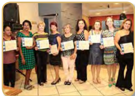
Atletas homenageadas, categoria 60+ do Minobol (vôlei adaptado)

Finalizando o convívio, foi servido um jantar para todos os presentes.