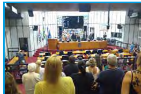
Sessão solene da Câmara Municipal, celebrando os 40 anos do Colégio Anchieta