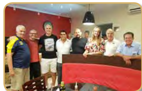
Convidados do voleibol e panathletas no convívio de janeiro