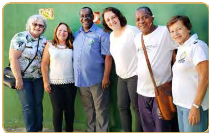
Integrantes do Panathlon e da Associação Criança Feliz