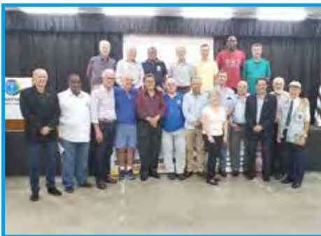
Parte dos panathletas na abertura do Congresso