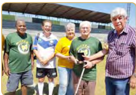
Comemorando seu aniversário em 2018