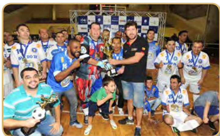
Equipe Bar do Zé/São Bento recebe o troféu Fair Play da categoria Super-veterano do Cruzeiroão 2019