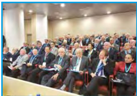
Representantes de 132 clubes votaram na Assembleia Extraordinária Eletiva