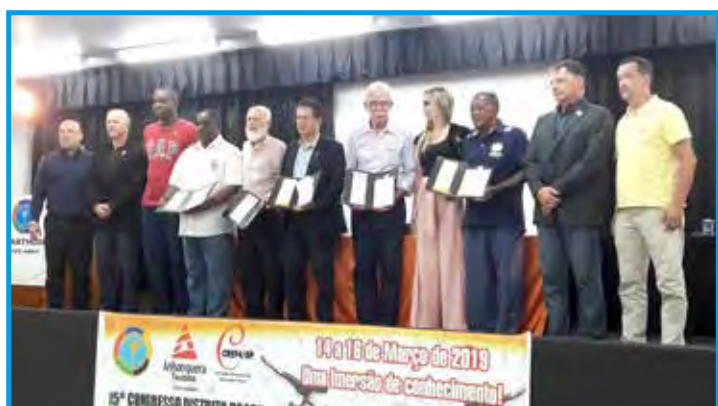
Abertura do Congresso Nacional do Panathlon na Faculdade Anhanguera em Taubaté/SP