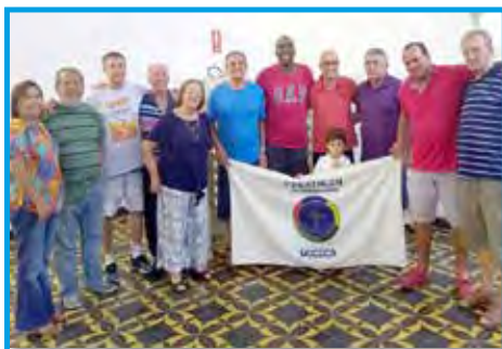
Convívio de abril realizado no Clube da Praça