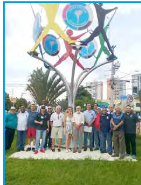
Visita dos panathletas ao marco do Panathlon