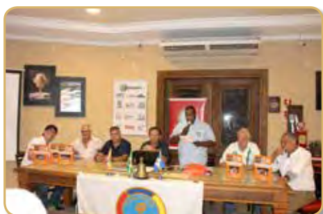
Mesa principal do convívio de abril dos clubes de Sorocaba e Votorantim

Finalizando mais um tradicional convívio, todos os presentes se confraternizaram num jantar.