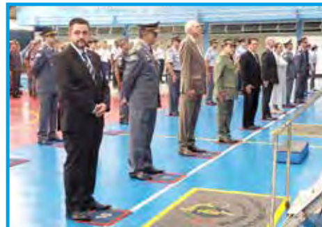
Homenageados da Escola de Educação Física da Polícia Militar