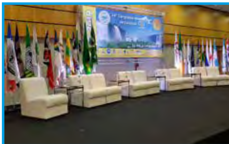
Palco da abertura do Congresso Internacional da FIEP