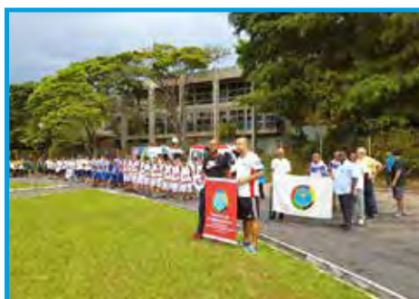
Panathletas iniciaram o desfile de abertura da Copa Votorantim de Futebol