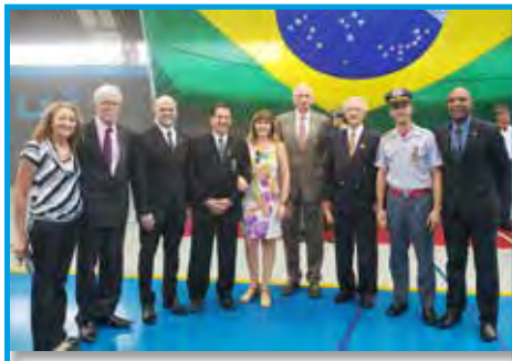
Panathletas com autoridades da Polícia Militar e da Educação Física