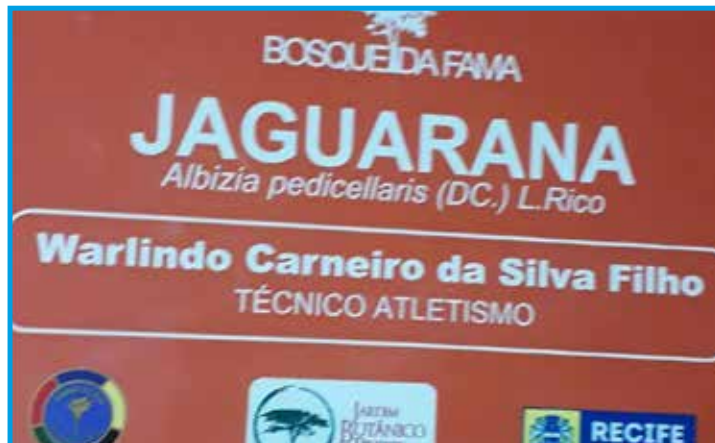
Modelos das placas