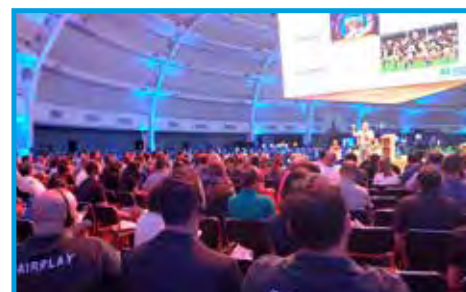
Plano geral das palestras simultâneas