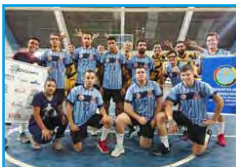
Equipe Campo Largo de voleibol adulto