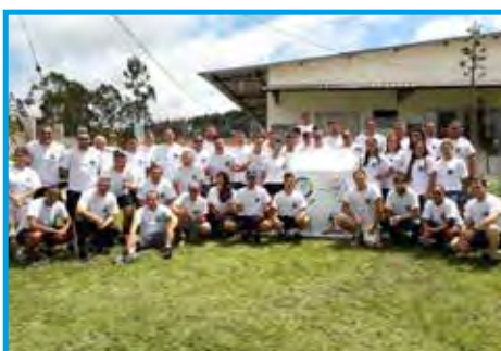
Participantes do Curso de Atualização