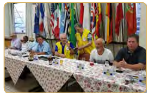
Mesa principal da reunião