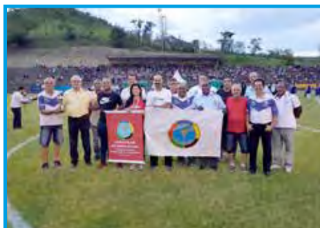
Panathletas na abertura da Copa