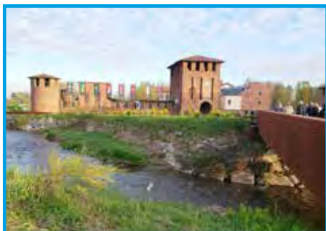
Visita cultural ao Castelo Visconteo, do século XIII (1437) em Legnano – Itália