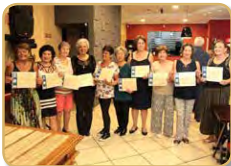
Atletas homenageadas, categoria 70+ do Minobol (vôlei adaptado)