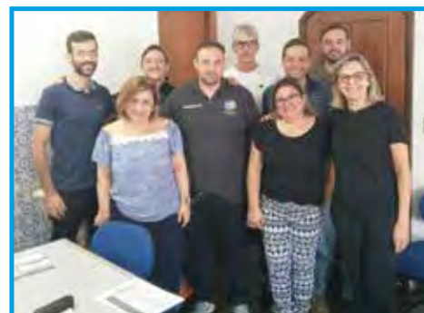
Reunião para firmar parceria com a Secretaria de Educação no Congresso Científico & Cultural