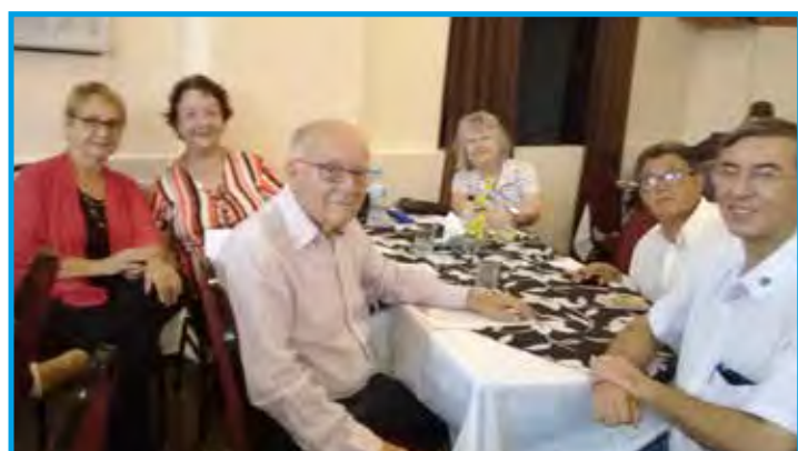
Panathletas de Taubaté/SP e familiares no jantar do Congresso no Plaza Suíte Hotel