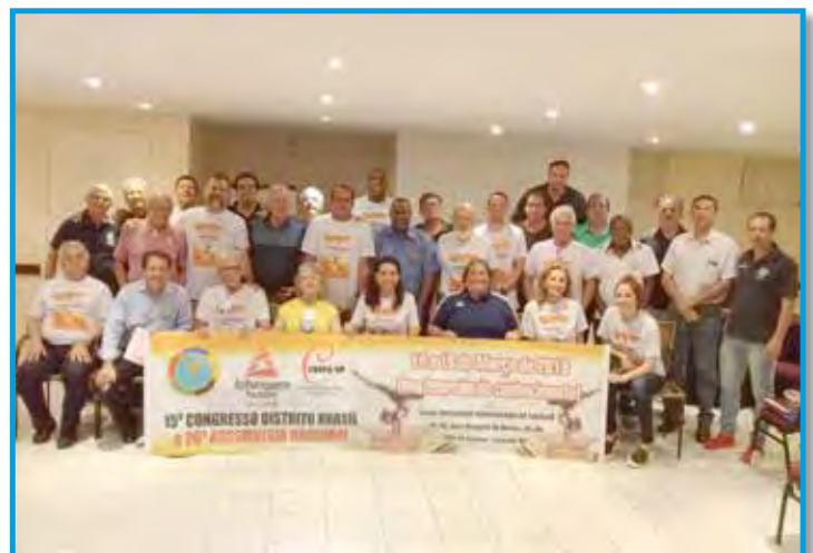
Participantes da 26ª Assembleia Nacional do Panathlon