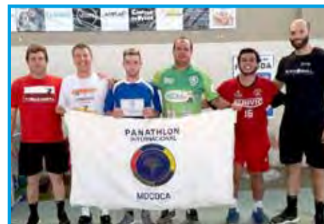
Equipe de Nova Resende/MG recebendo placa de Fair Play na 10ª edição da Copa Derla de Handebol