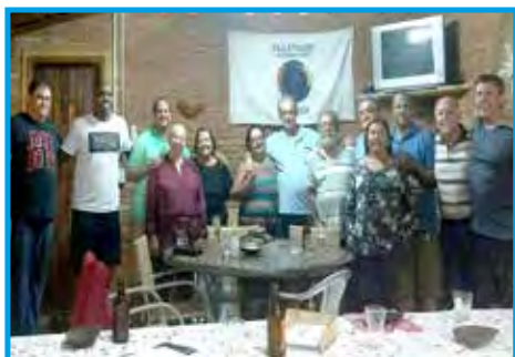
Panathletas participantes do convívio de março