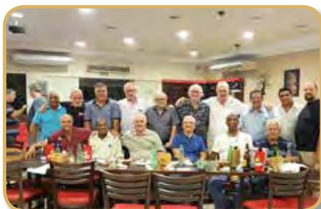
Panathletas de Sorocaba e Votorantim