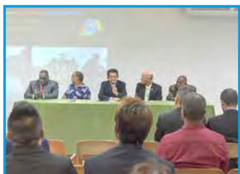
Mesa principal da assembleia de fundação