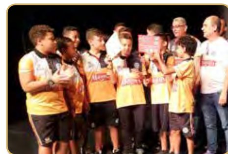
Equipe ASF / Magnus Futsal, campeão mundial Sub 13