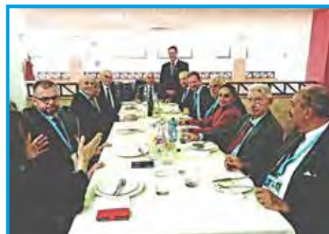
Almoço de encerramento na Universidade LIUC Castellanza