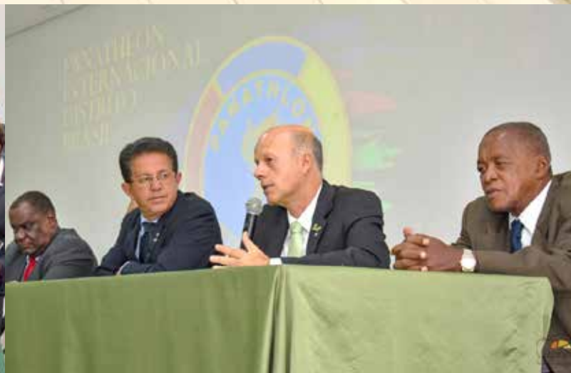
Praia Grande/SP fundou o seu Panathlon Club