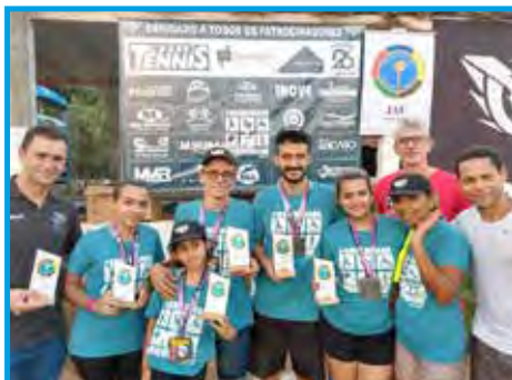
Panathlon Club Jaú/SP ofereceu todos os troféus da 2ª Caminhada da Diversidade