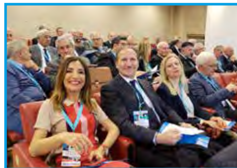
Participantes da Assembleia Extraordinária Eletiva no auditório da Universidade LIUC em Castellanza