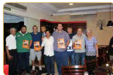
Representantes das equipes campeãs do Cruzeiroão de Futsal 2019