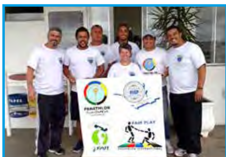
Organizadores do Curso de Atualização de Regras do Futsal