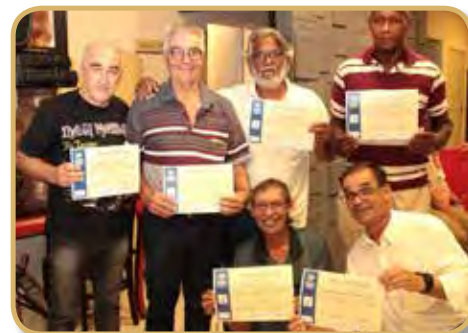
Atletas homenageadas, categoria 60+ e 70+ do Minobol (vôlei adaptado)