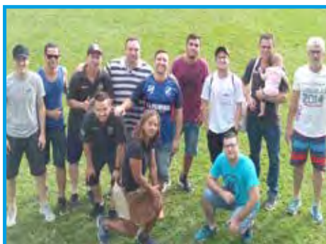
Reunião para definição do Congresso Científico & Cultural do Panathlon Distrito Brasil em Jaú/SP