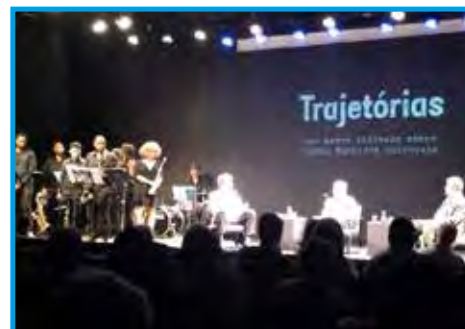
Cerimônia no auditório do Sesc Piracicaba/SP