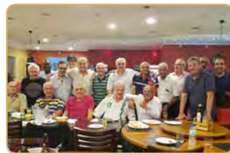
Parte dos panathletas posou para foto