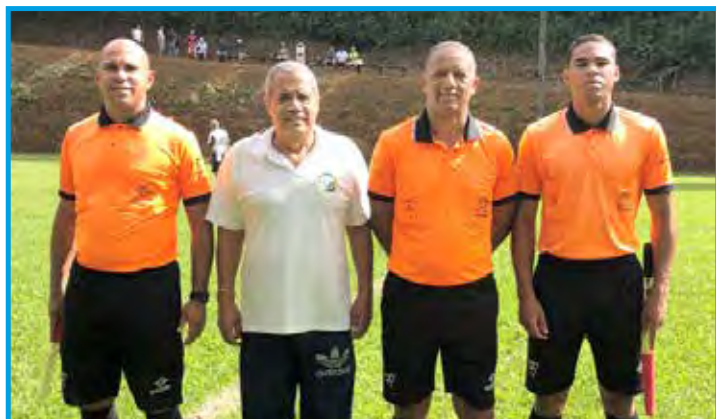
Arbitragem da primeira rodada do 2º Torneio de Futebol Sênior Panathlon