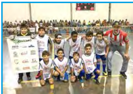
Equipe B de futsal do Sub-08 Champions Escola de Futebol