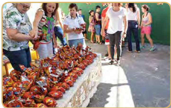
Momento da entrega dos ovos de páscoa