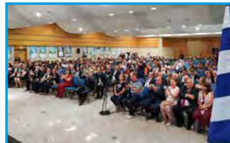
Grande público presente na abertura