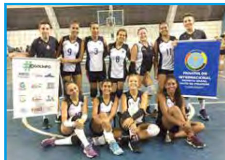
Equipe União Vôlei, categoria adulta