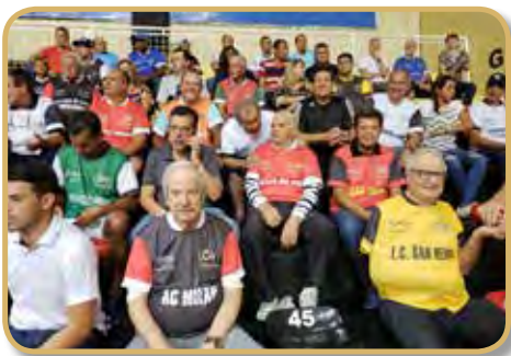
Área reservada para os homenageados