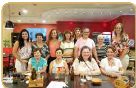
Presença feminina no primeiro convívio do ano no mês de janeiro

O convívio de janeiro foi tradicionalmente finalizado com os presentes se confraternizando num jantar.