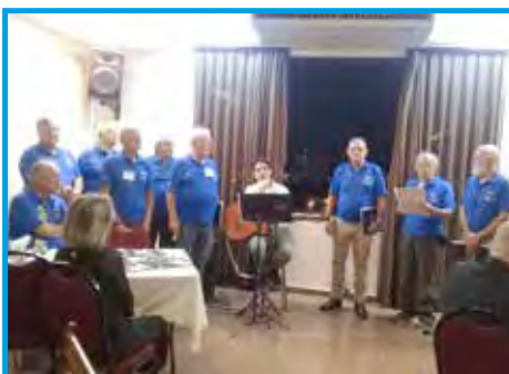
Coral formado por panathletas de Taubaté/SP no jantar de confraternização