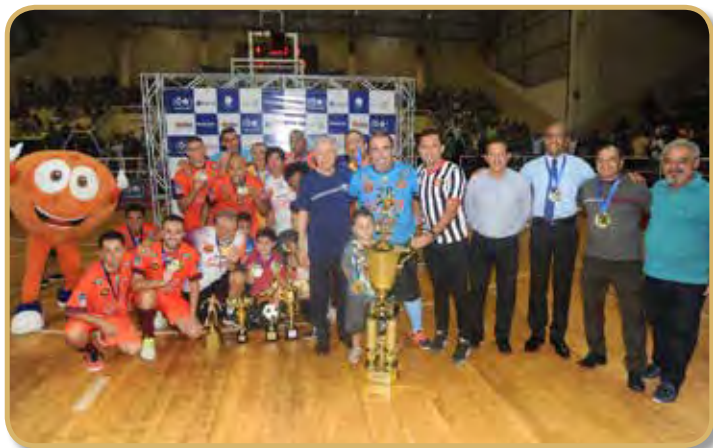
Equipe Manchester CJA Sports e autoridades no momento da entrega do troféu de campeão