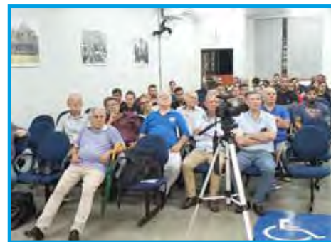
Panathletas e alunos na abertura do Congresso na Faculdade Anhanguera de Taubaté/SP