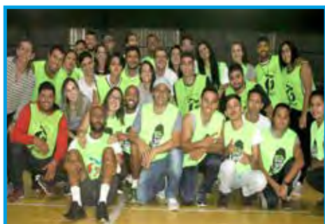
Alunos do bacharelado responsável pela organização dos Jogos da Educação Física (JEFs)