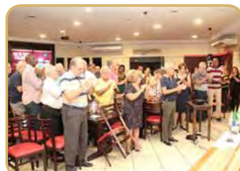
Saudação ao pavilhão na abertura do convívio de fevereiro