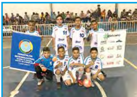
Equipe Sub 10 do Rota Futsal