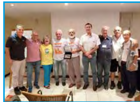
Sócios do Panathlon Club Taubaté/SP fizeram a recepção aos participantes da Assembleia