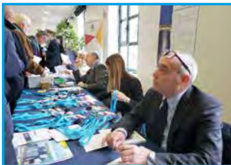
Mesa de cadastro dos clubes com direito a voto