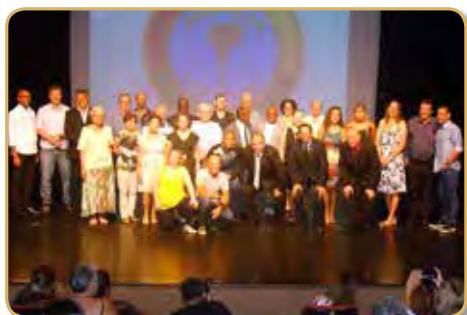
Panathletas presentes no evento