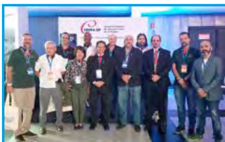
Conselheiros e funcionário no stand do Conselho Regional de Educação Física (Cref4/SP)