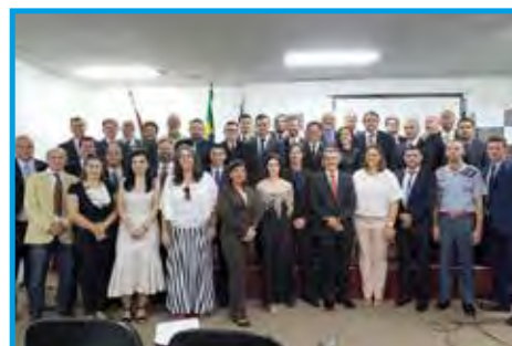
Conselheiros e delegados do CREF4/SP