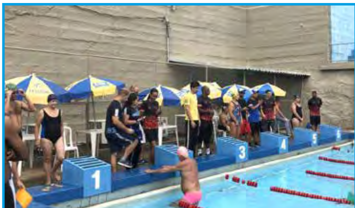
Primeira etapa da 2ª Copa JF de Natação no mês de abril