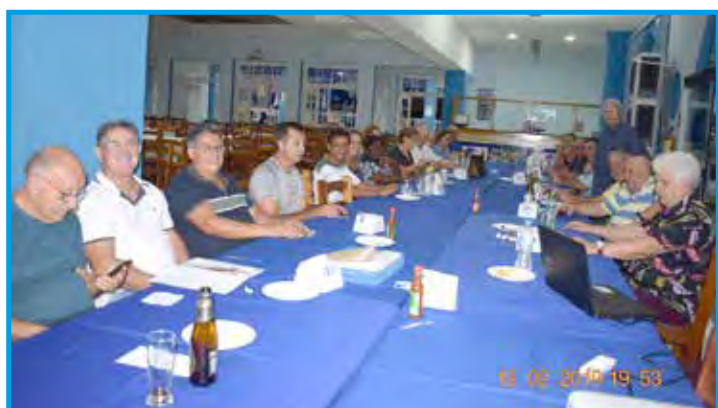
Convívio de fevereiro

A novidade do Congresso e Assembleia, realizados no Plaza Suíte Hotel e Faculdade Anhanguera, foi a cerimônia dos Correios, o qual lançou oficialmente o selo comemorativo dos 45 anos do Panathlon Club no Brasil.