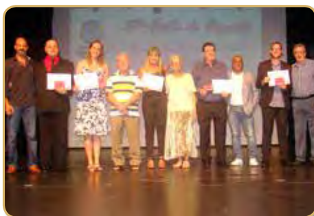
Homenageados da arbitragem e panathletas