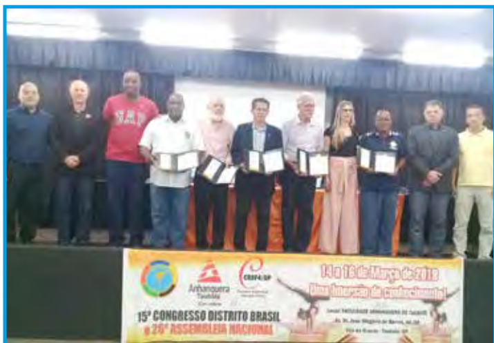
Momento do lançamento do selo 45 anos do Panathlon no Brasil na abertura do Congresso do Distrito Brasil

Finalizando o evento, houve a prestação de contas do Distrito Brasil, que foi aprovada por todos, e na sequência ocorreu a escolha da sede para a 27ª Assembleia Nacional em 2020, sendo aprovada a cidade de Jaú/SP. Praia Grande/SP também se colocou à disposição, devendo ser a sede em 2021.