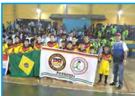
Equipe do Paraguai na Copa Sul-americana de Futebol