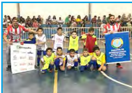
Equipe de futsal do Sub-08 Champions Escola de Futebol

Em abril o Panathlon Club Salto de Pirapora comemorou um ano de fundação com divulgação nas redes sociais.