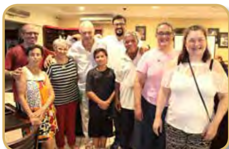
Panathletas e convidados no convívio de janeiro