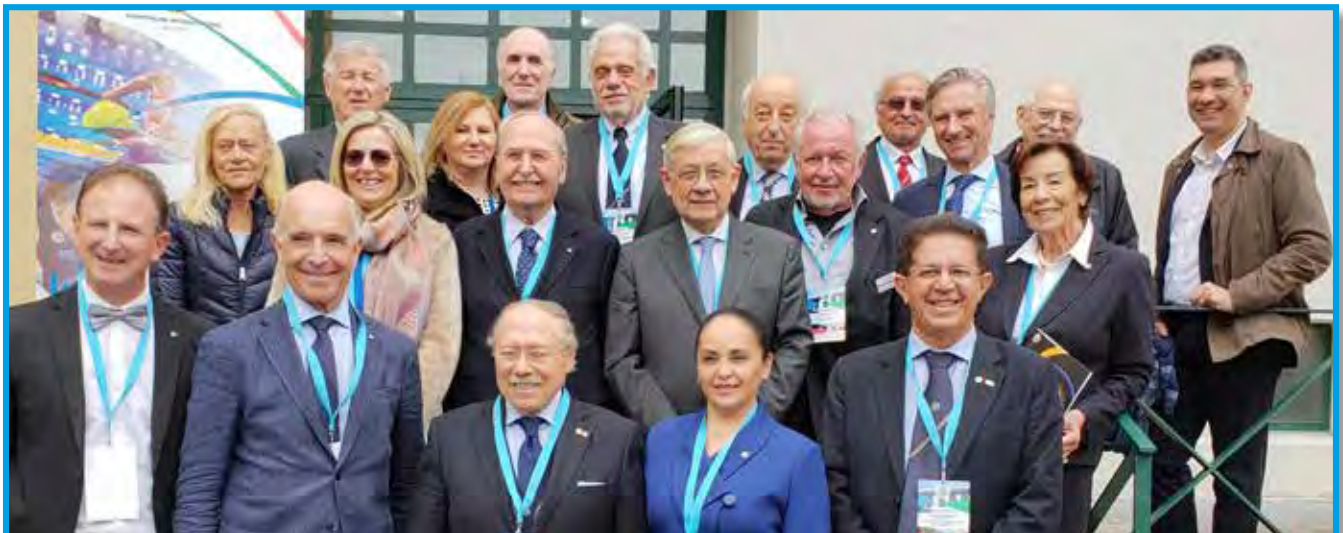
Representantes de diversos países que participaram da Assembleia Internacional do Panathlon

Encerrando o evento, realizou-se a Assembleia Ordinária do Distrito Italiano, que aprovou todas as propostas por unanimidade.