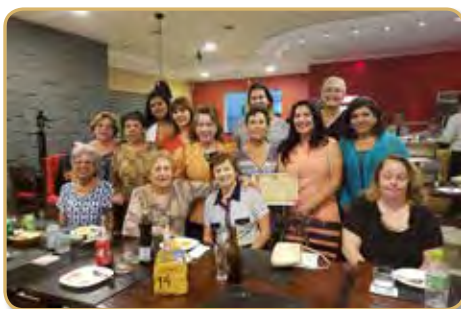
Presença feminina no convívio de abril