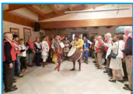
Recepção dos malabaristas e dançarinos, no Solar de San Magno