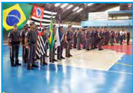
Cenário das homenagens, ginásio "Cel. PM Pedro Dias de Campos"