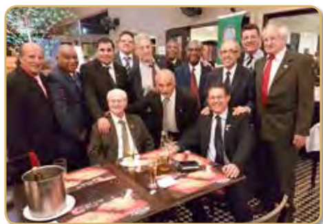
Aniversário do Panathlon Club Sorocaba em 2016 no Restaurante do Alemão