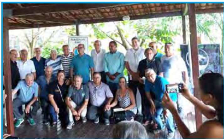
Panathletas e homenageados no Bosque da Fama de Recife/PE

Num segundo momento ocorreu o protocolo dos homenageados selecionados pelos critérios do Panathlon Club Recife, entre eles técnicos esportivos pernambucanos com vida esportiva iniciada naquele Estado e com participação na seleção brasileira em competições como o Sul-americano, Pan-americano, Mundial e Olimpíadas. Fechando a cerimônia, houve a entrega da Comenda de Mérito Panathlético, seguida do plantio das mudas de árvores nativas brasileiras.