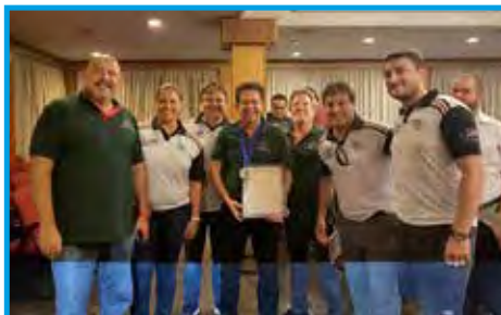
Homenagem de 70 anos da FIEP aos representantes de São Paulo/SP