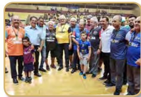
Autoridades, panathletas e homenageados