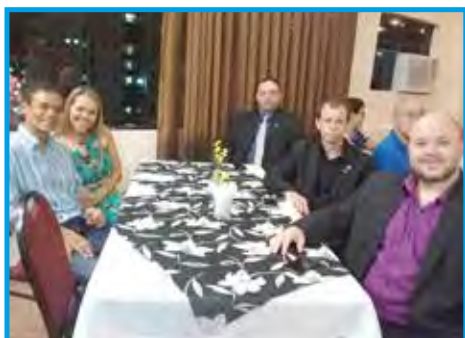
Membros do Panathlon de Taubaté/SP e Jaú/SP no jantar de confraternização no Plaza Suite Hotel