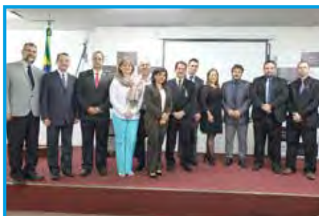
Panathletas presentes no evento