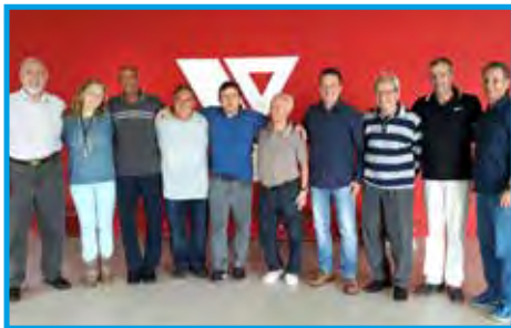
Panathletas e esportistas na apresentação do relatório da Secretaria de Esportes