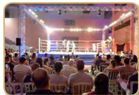
Presença de um bom público