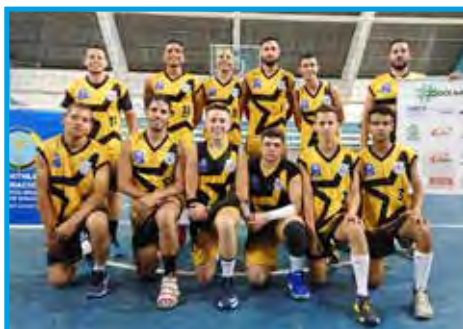
Equipe do Volley Stars, categoria adulta