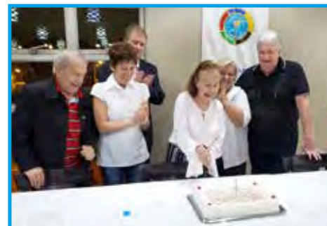
Aniversariantes do mês de fevereiro