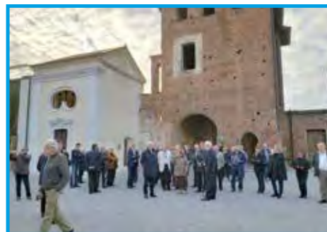
Grupo de panathletas na parte interna do Castelo Visconteo