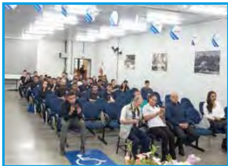
Alunos de Educação Física da Faculdade Anhanguera de Taubaté/SP