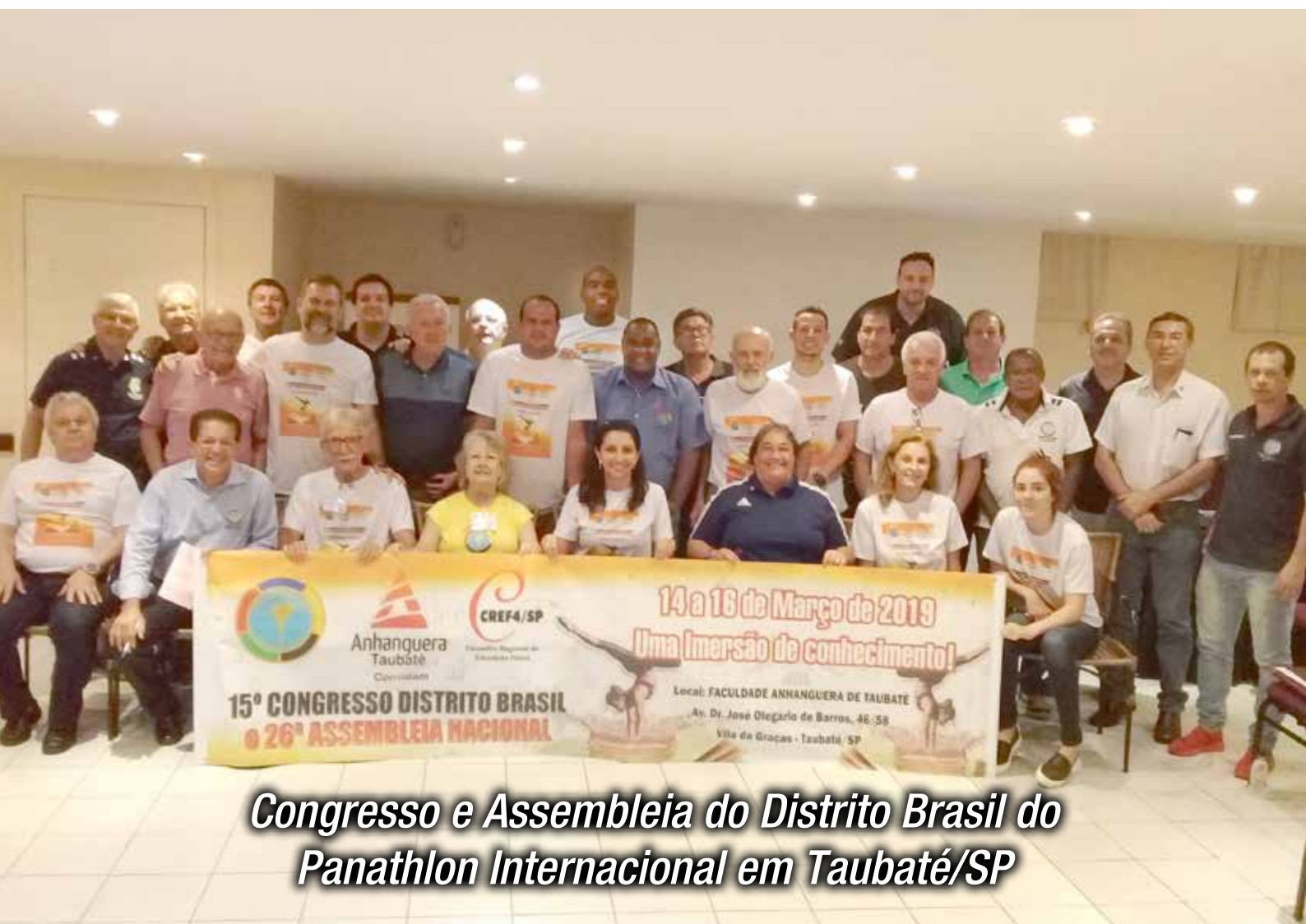
Congresso e Assembleia do Distrito Brasil do Panathlon Internacional em Taubaté/SP