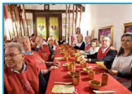
Plano geral do jantar medieval