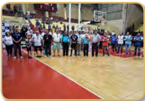
Momento da homenagem aos representantes de todos os campeões