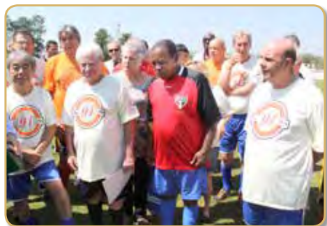
Comemoração de 91 anos do Mickey em 2016 no Estádio Municipal Walter Ribeiro