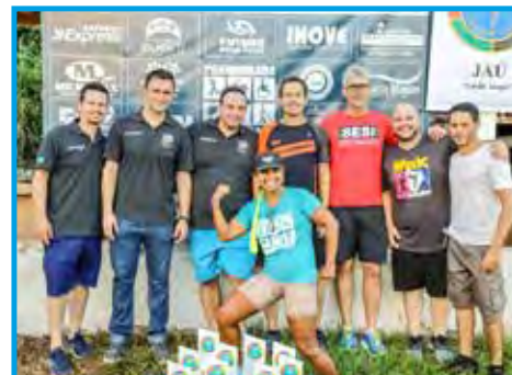
Panathletas na 2ª Caminhada da Diversidade