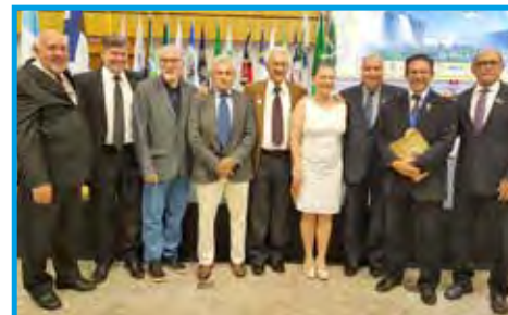
Representantes de São Paulo/SP do Conselho Federal e Regional