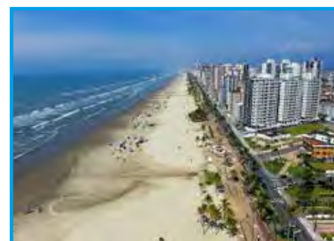
Vista aérea da cidade de Praia Grande/SP